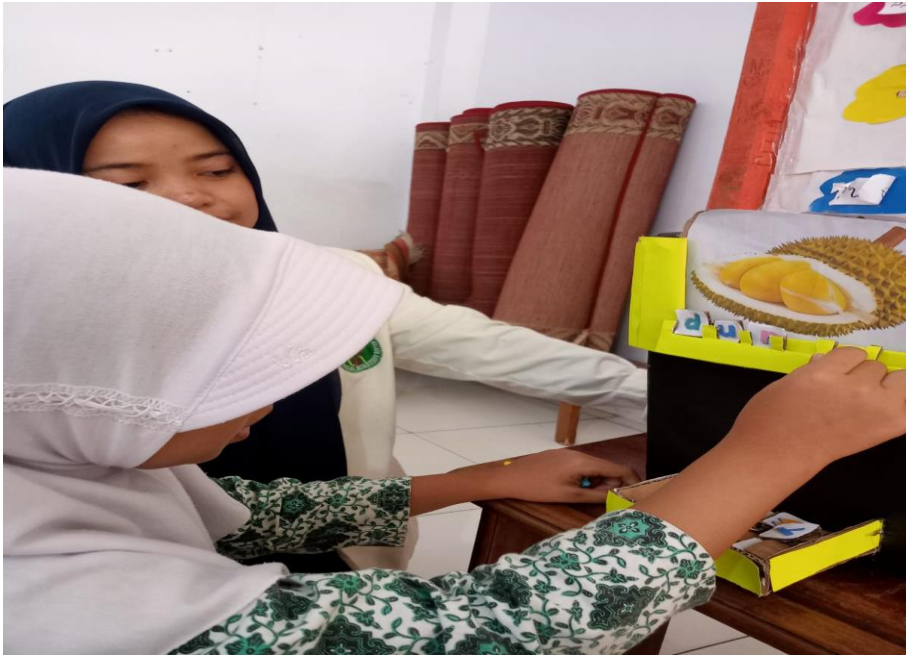
Siswa sedang melaksanakan pretest