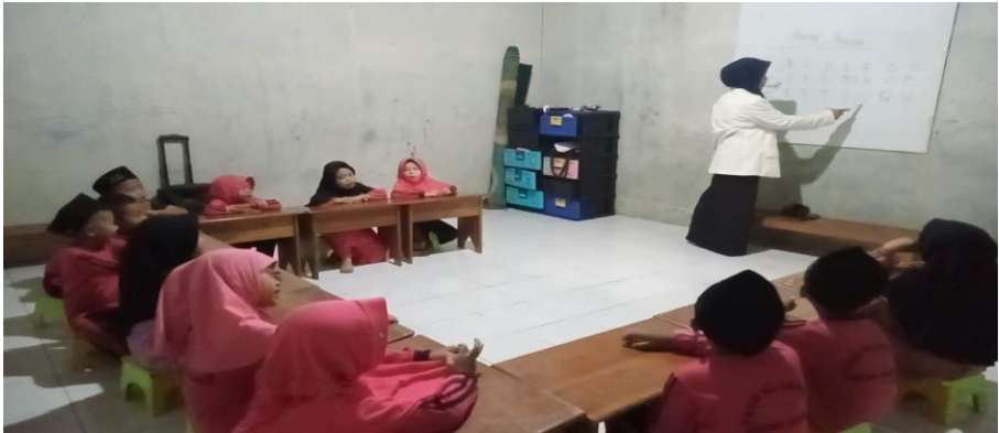
Siswa sedang melaksanakan posttest