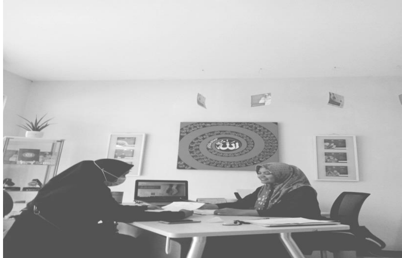
Foto Wawancara dengan salah satu peserta Asuransi Fulnadi di PT. Asuransi Takaful Keluarga Serang City