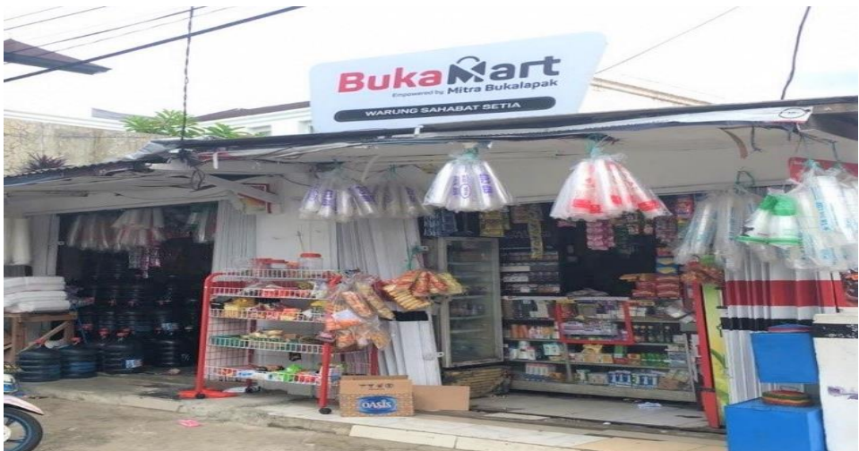
Penerimaan ( Borrower ) Warung Sahabat Setia – Jakarta Selatan