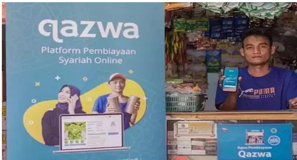
Penerimaan Pendanaan ( Borrower ) Toko Berkah – Jakarta Selatan