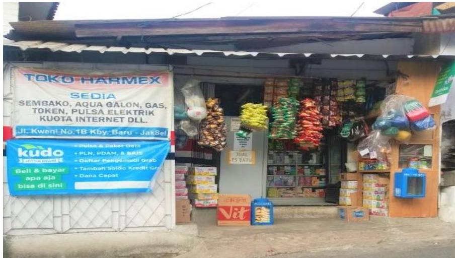
Penerima Pendanaan ( Borrower ) Toko Harmex Kebayoran Baru – Jakarta Selatan