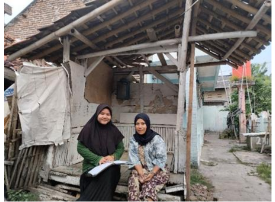
Wawancara dengan Ibu Pretty