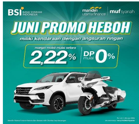
Lampiran 2: Brosur BSI OTO