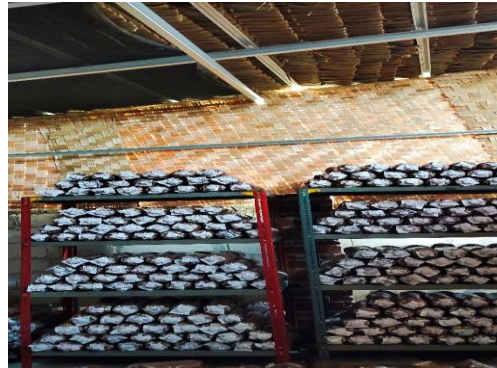
Proses sterilisasi Baglog setelah pembibitan selama 3 minggu sampai 4 minggu.