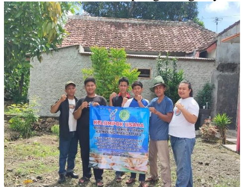
Kelompok Usaha Budidaya Jamur Tiram kampung margaluyu