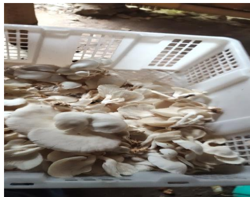
Proses panen jamur tiram.