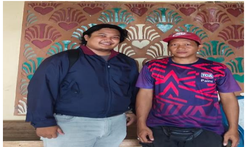
ketua RT. 007 Kampung Margaluyu