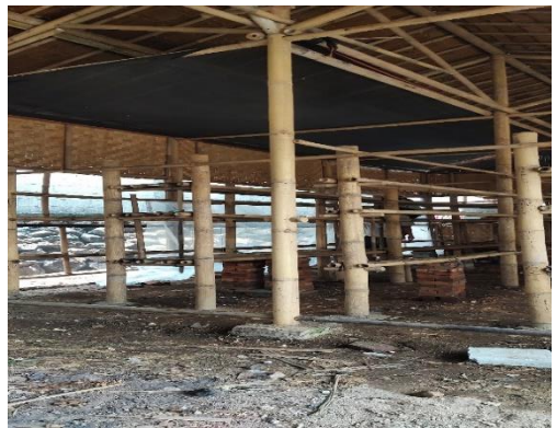
Proses pembuatan Kumbung (rumah produksi jamur tiram).