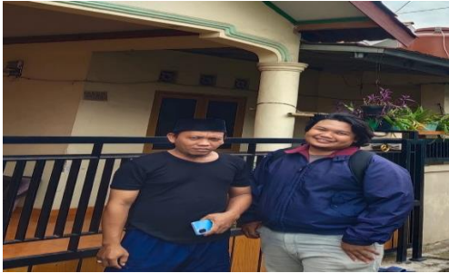
ketua RW. 004 Kampung Margaluyu