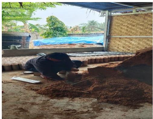
Serbuk kayu ini merupakan bahan dasar untuk dijadikan Baglog (media tanam jamur tiram)