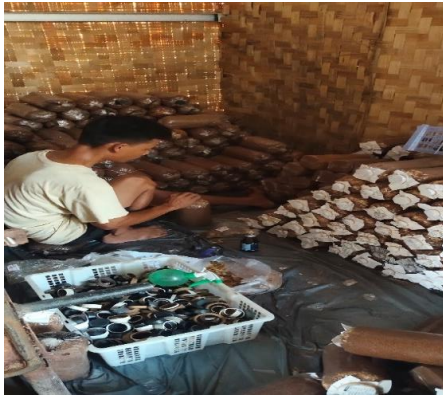
Proses pembibitan F2 jamur tiram yang dicampurkan ke dalam Baglog.

Proses pengovenan untuk mematikan bakteri lain yang tercampur dalam Baglog selama 11 jam.