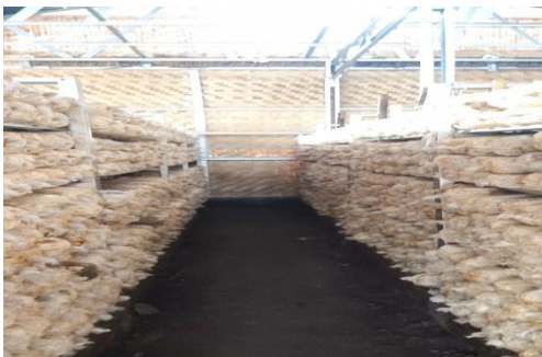
Proses penyusunan hasil sterilisasi Baglog ke dalam Kumbung ketika usia Baglog sudah memasuki umur 4 minggu, hingga Baglog memunculkan jamur.