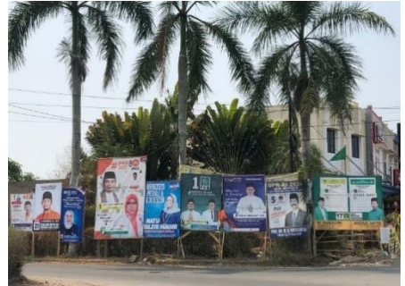
Pemasangan Alat Peraga Kampanye di Kecamatan Taktakan