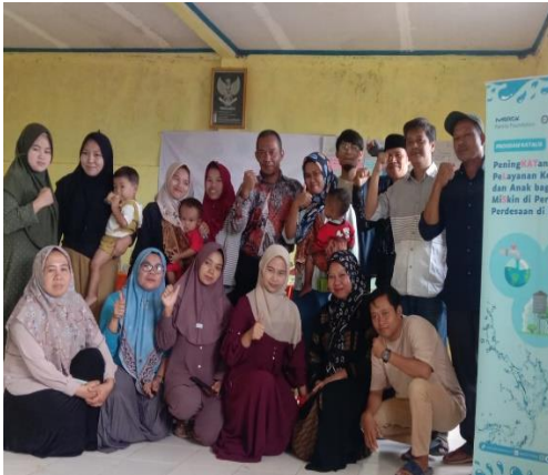
Kegiatan edukasi kepada masyarakat tentang kesehatan ibu dan anak serta stunting