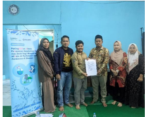
Sosialisasi Program, Identifikasi DIM (Daftar Identifikasi Masalah) dan Pembentukan Komunitas KIA (Komunitas Ibu dan Anak)