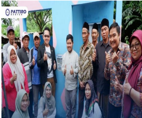
Peresmian penyediaan sanitasi dan air bersih di Desa Cikasungka