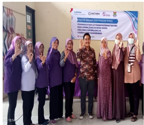
Kegiatan FGD Peningkatan Layanan Kesehatan Ibu Dan Anak serta stunting Di Desa Saga Kec Balaraja