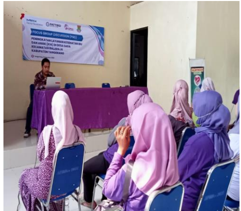
Proses kegiatan FGD