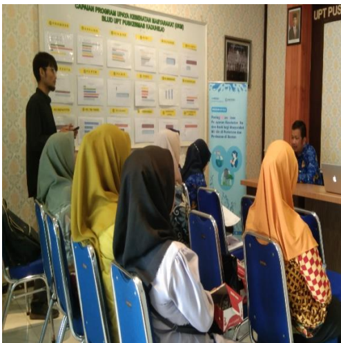
Kegiatan audiensi puskesmas