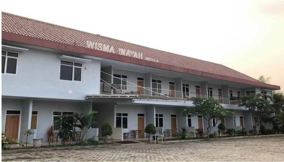
Gambar 1. Bangunan Hotel Inayah Syariah