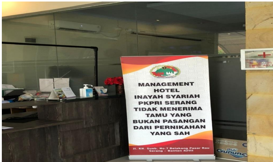
Gambar 7. Peraturan Hotel Inayah Syariah tidak menerima tamu yang bukan mahramnya