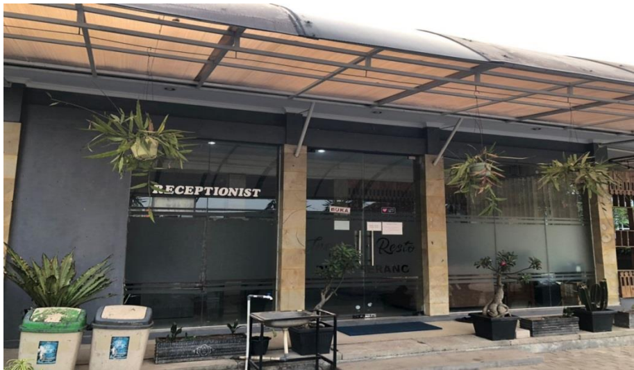
Gambar 2. Kantor Receptionist Penerimaan Tamu