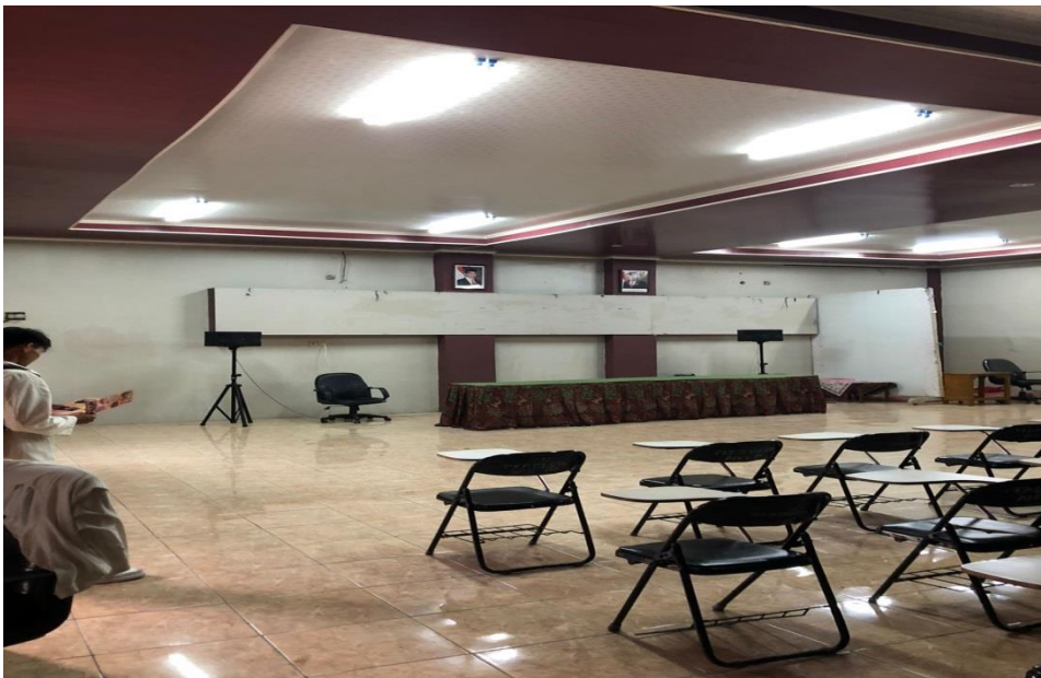
Gambar 4. Meeting Room Hotel Inayah Syariah