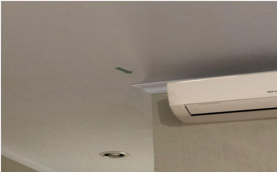
Gambar 11. Petunjuk arah kiblat di setiap kamar Hotel Inayah Syariah