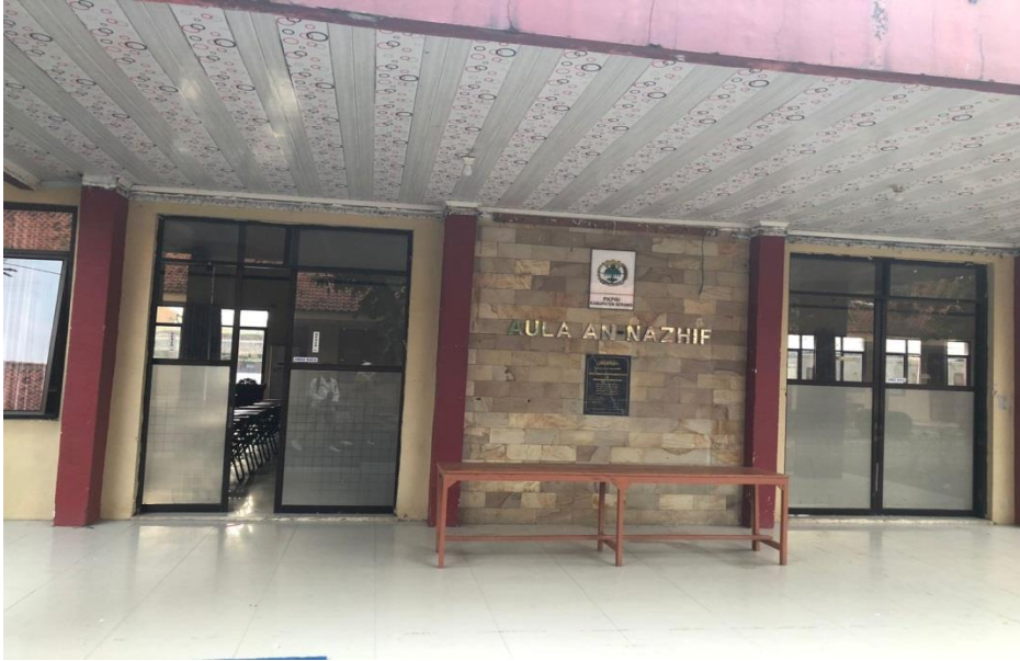
Gambar 3. Aula/Ballroom yang biasa dipergunakan untuk acara wedding