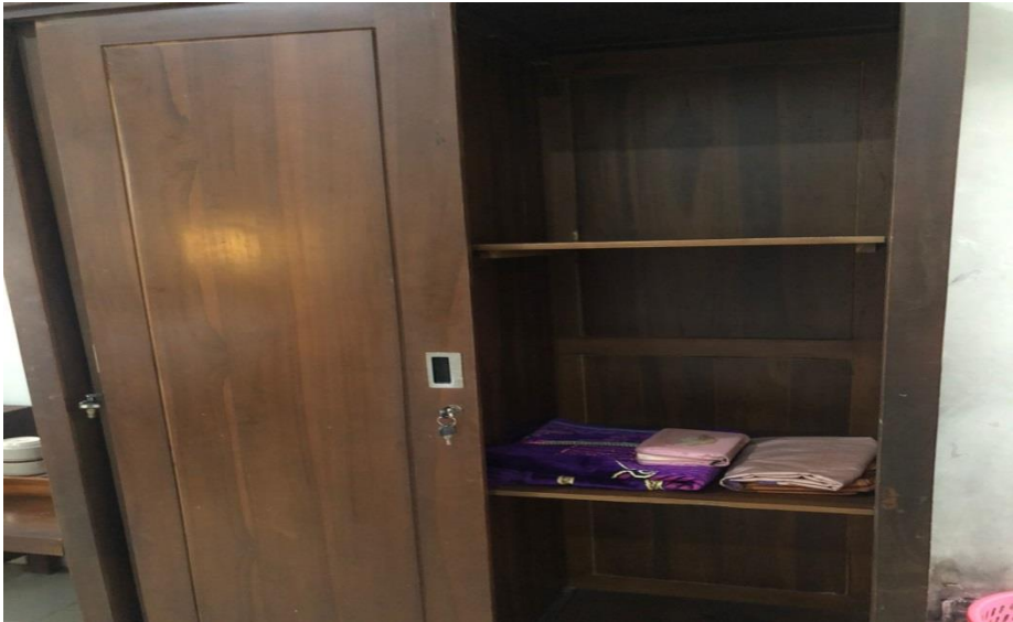
Gambar 10. Peralatan ibadah di setiap kamar Hotel Inayah Syariah