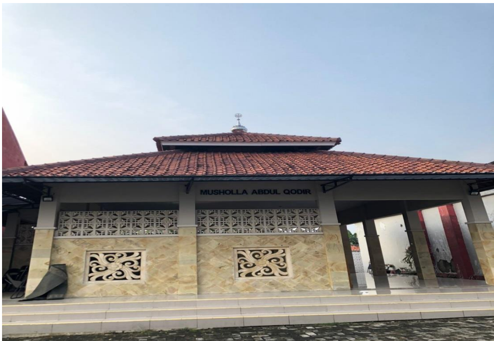
Gambar 6. Mushola Hotel Inayah Syariah