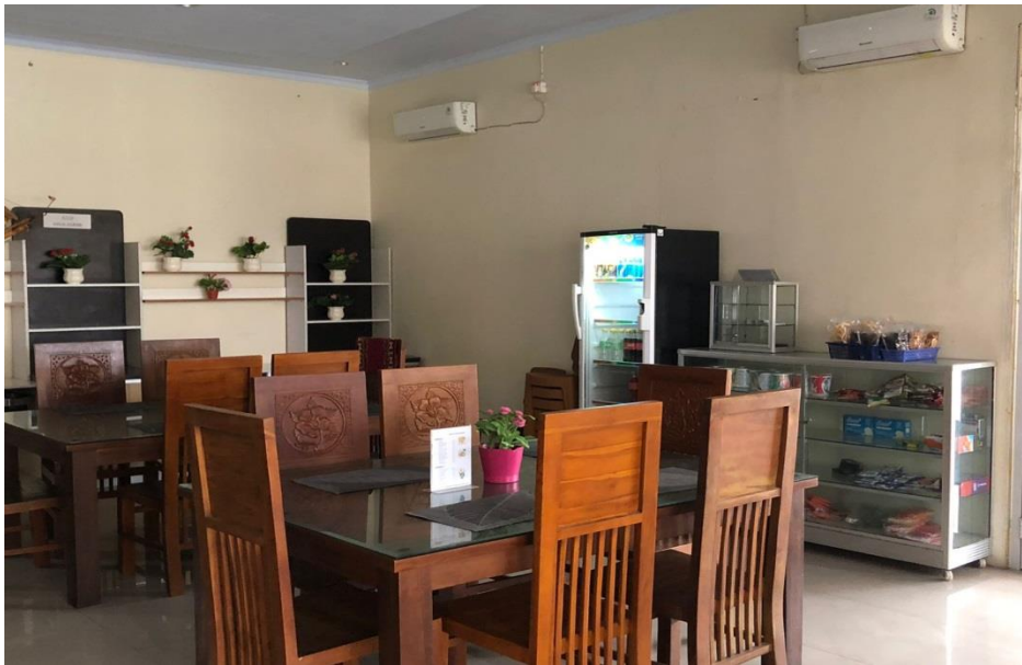
Gambar 5. Restoran/Kantin Hotel Inayah Syariah