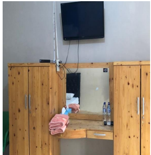
Gambar 9. Kondisi dalam kamar Hotel Inayah Syariah