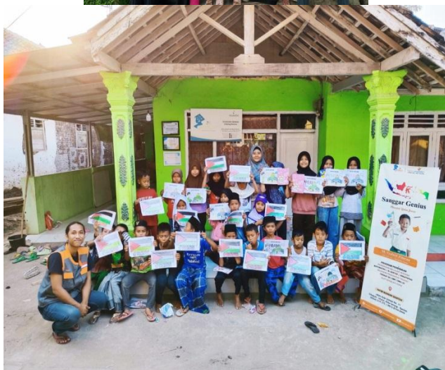
Kegiatan Genius Ceria di Sanggar Genius Baros dan Sanggar Genius Curug yang bertemakan “Kepedulian Terhadap Palestina”.