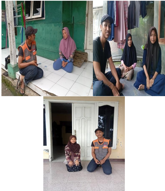
Wawancara dengan orang tua anak binaan, alumni binaan di Sanggar Genius Petir, dan penerima manfaat Beasiswa Yatim Mandiri (BESTARI)