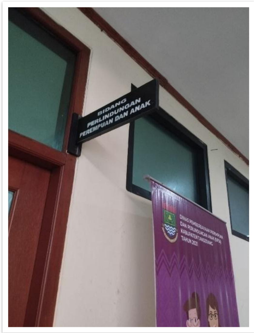
Ruang Bidang Perlindungan Perempuan dan Anak