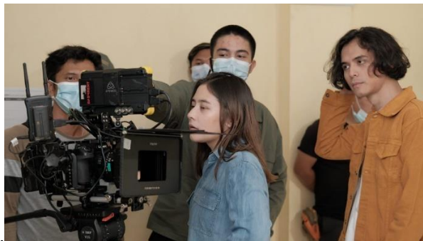
( Dibalik layar ku kira kau rumah/pengambilan shoot)