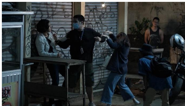
( Scene pengambilan film “ Ku Kira Kau Rumah”)