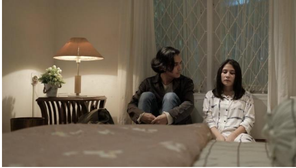
( Scene Ku kira Kau Rumah)

( Proses Shooting Film/ Behind The Scene “ Ku Kira Kau Rumah”)