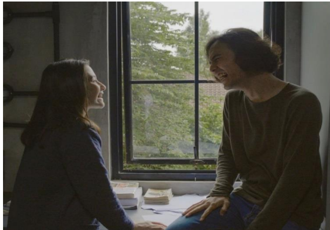
( Bagian poster film ku kira kau rumah” )