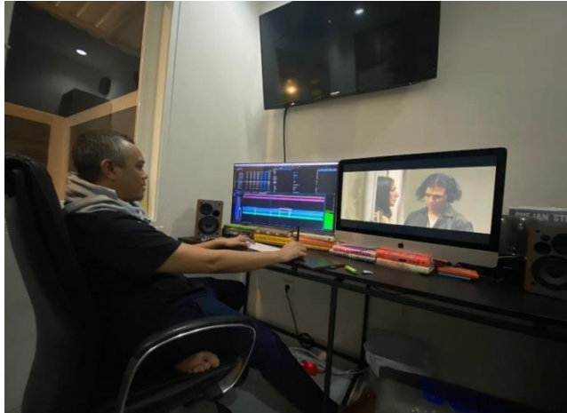
( Pasca editing dalam scene-scene film “ Ku Kira Kau Rumah”)