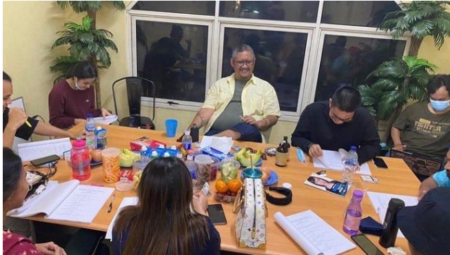
( Meeting untuk scenario film “ Ku Kira Kau Rumah”)