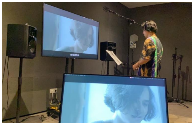
( Proses pengisian Ost. Film Ku Kira Kau Rumah)