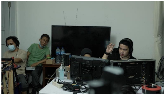
( Proses direct yang dilakukan oleh sutradara film Ku Kira Kau Rumah “Umay Shahab”)