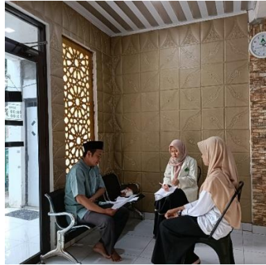
Pelaksanaan Layanan Konseling Individual Siklus II oleh Guru BK atau Konselor kepada Klien di Pondok Pesantren Fajrul Karim