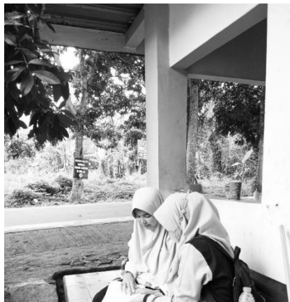
Wawancara dengan santri sesudah pelaksanaan layanan konseling individual