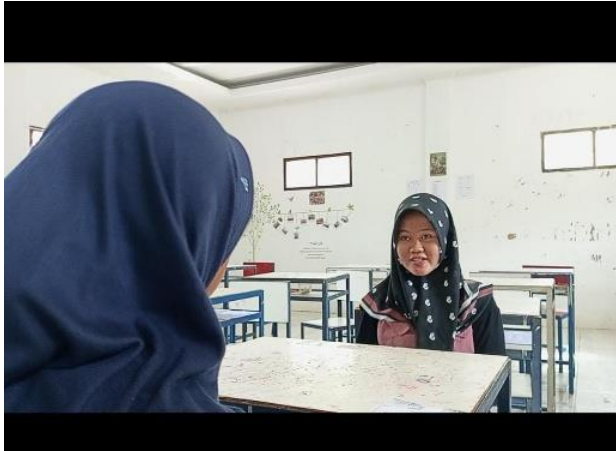
Wawancara dengan santri sebelum pelaksanaan layanan konseling individual.