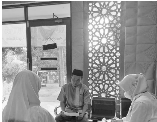
Pelaksanaan Layanan Konseling Individual Siklus I oleh Guru BK atau Konselor kepada Klien di Pondok Pesantren Fajrul Karim