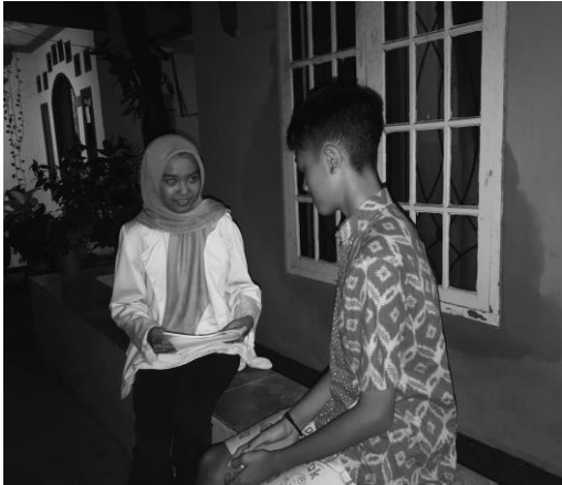
Pertemuan 3 responden MD