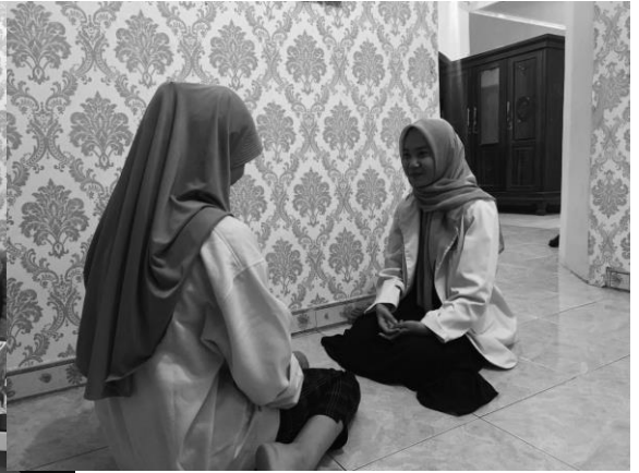
Pertemuan 1 responden NF