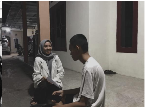
Pertemuan 4 responden AJ