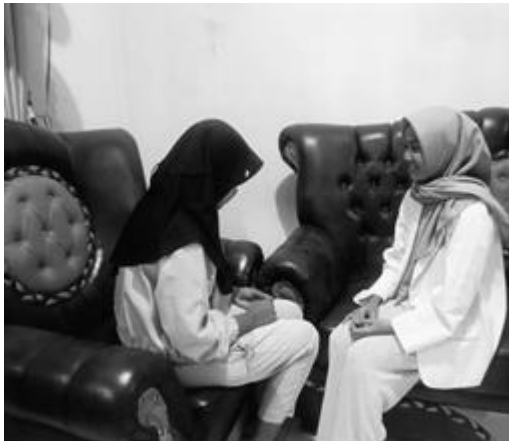
Pertemuan 4 responden VA