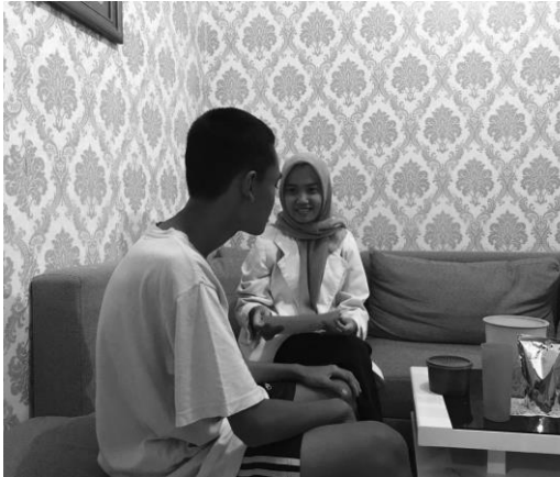
Pertemuan 1 responden AJ