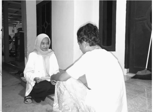
Pertemuan 4 responden MD