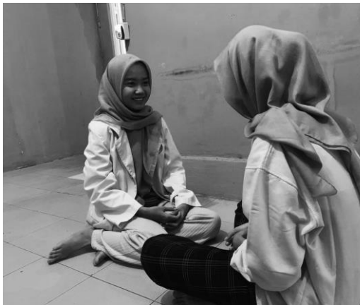
Pertemuan 2 responden NF