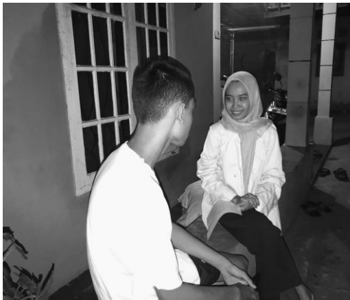
Pertemuan 3 responden AJ