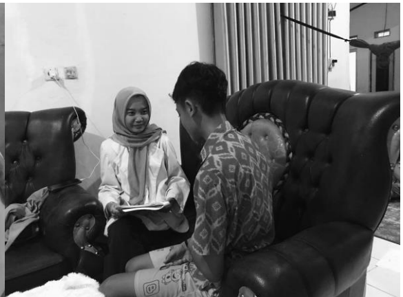
Pertemuan 2 responden MD