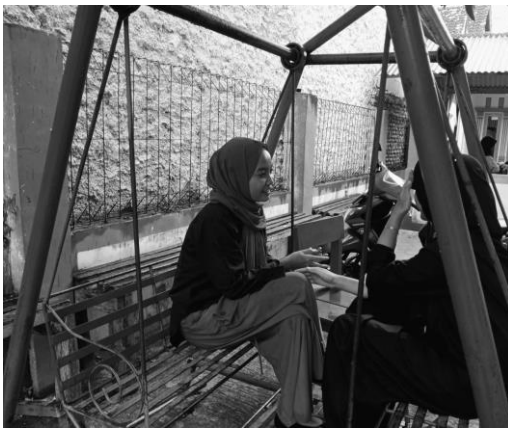
Pertemuan 3 responden SN