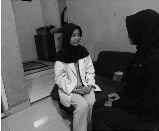
Pertemuan 2 responden VA