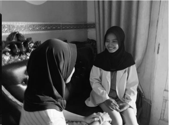
Pertemuan 2 responden SN