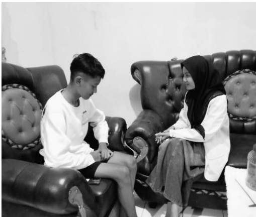
Pertemuan 1 responden MD