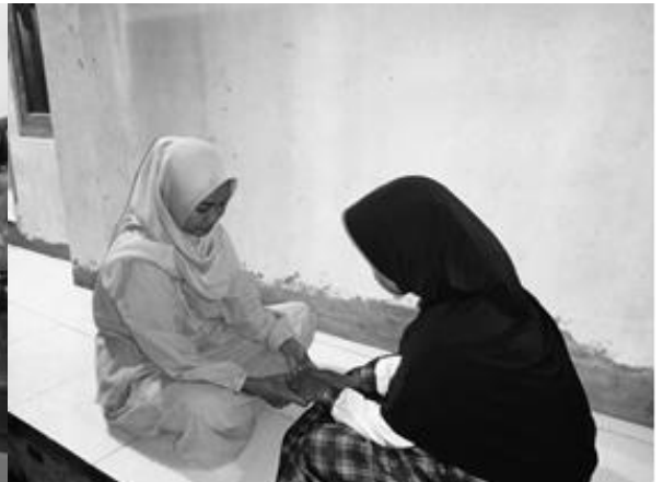
Pertemuan 4 responden SN