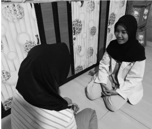
Pertemuan 1 responden SN