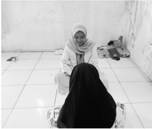
Pertemuan 4 responden NF