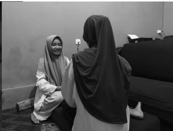
Pertemuan 3 responden NF