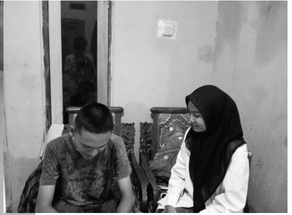
Pertemuan 2 responden AJ