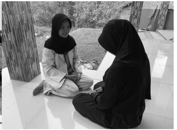
Pertemuan 1 responden VA