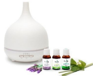
koleksi diffuser trulife