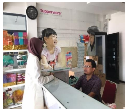
wawancara dengan Pak Syukron selaku warehouse