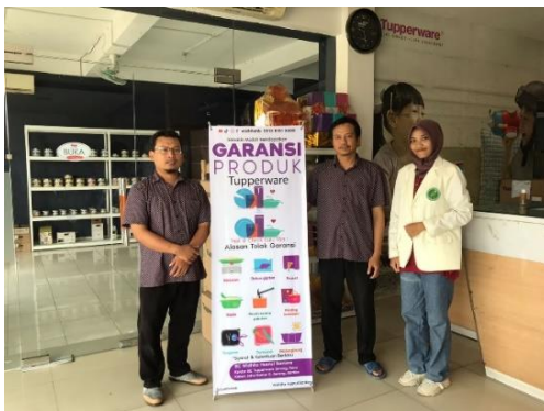
Foto dengan staff distributor PT. Widhita Husnul Bantera