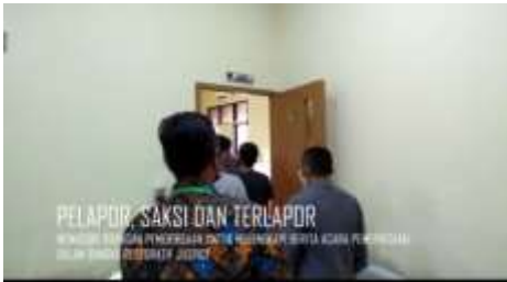
PELAPOR, SAKSI DAN TERLAPOR WASDAK DAN PENGABDIAN SAKSI MELAKUKAN SEMUA ACARA PENYERAHAN DAN LANGKA BERTERAKAT JUDICIARY