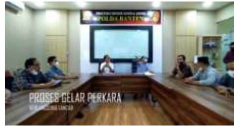
PROSES GELAR PERKARA KORUS BANTEN