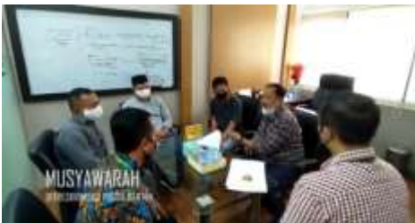
MUSYAWARAH KORUS BANTEN