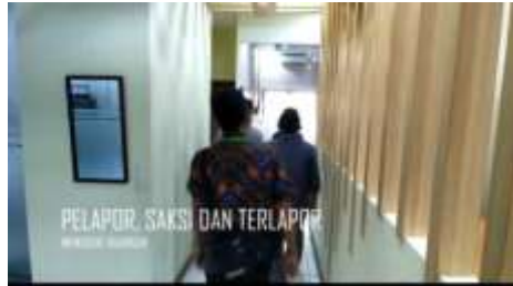
PELAPOR, SAKSI DAN TERLAPOR KORUS BANTEN