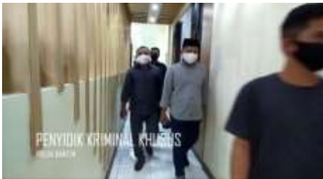
PENYIDIK KRIMINAL KHUSUS KORUS BANTEN