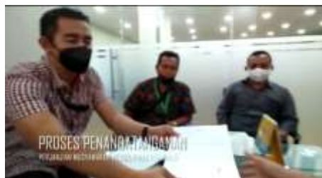
PROSES PENANGGAPAN PERKARA RESTORATIF PERKARA BANTEN