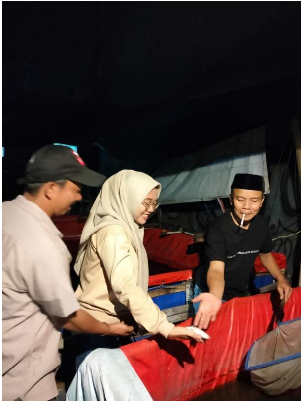
Foto di Tempat Budidaya Ikan Air Tawar