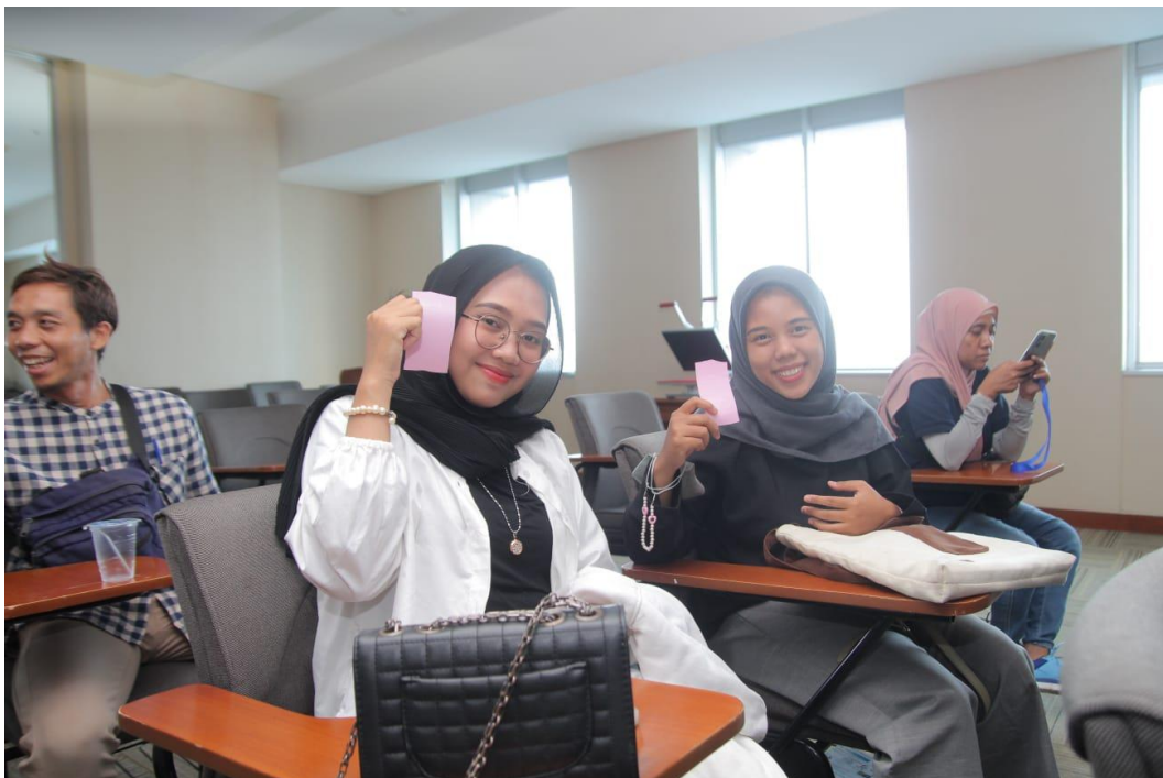
Foto Bersama dengan Penerima Manfaat Kegiatan Sablon Zahro Shidqin Aliyya