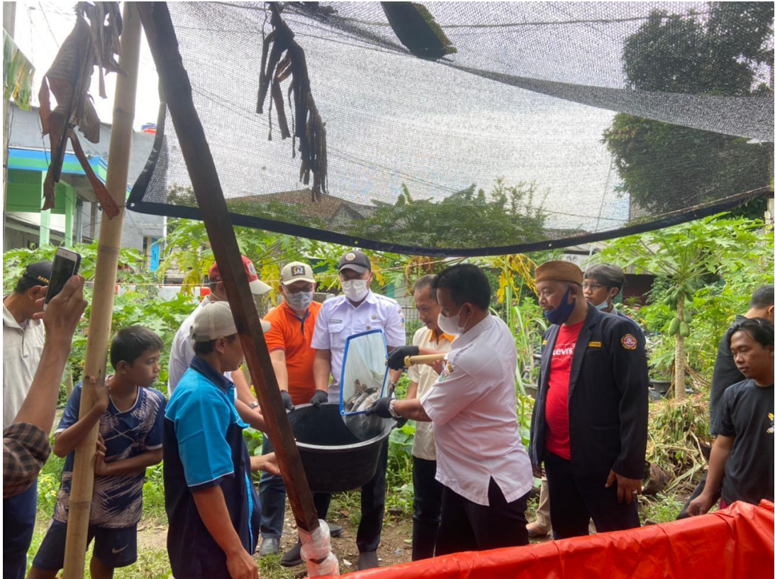
Foto Kegiatan Budidaya Ikan Air Tawar