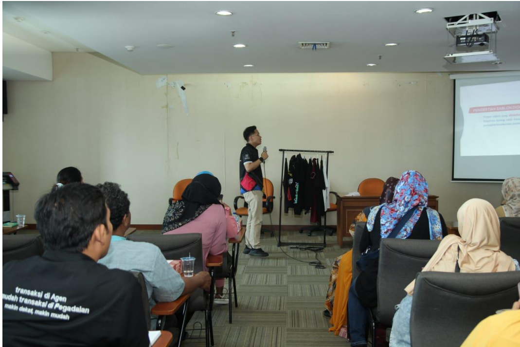
Foto Kegiatan Sablon