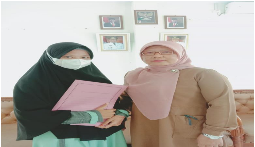
Wawancara dengan kepala seksi pembangunan Kelurahan Kedaleman