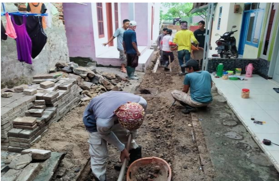
Partisipasi Masyarakat dalam Proses Pembangunan