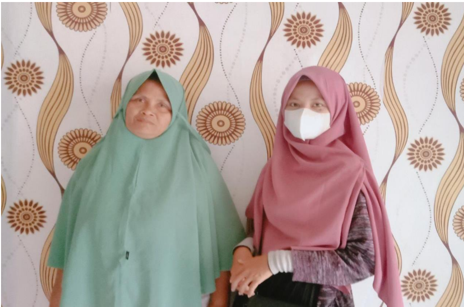
Wawancara dengan ibu RT. 01 Kampung Kadipaten