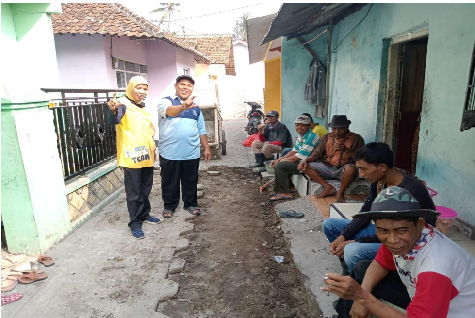
Partisipasi Masyarakat dalam Proses Pembangunan