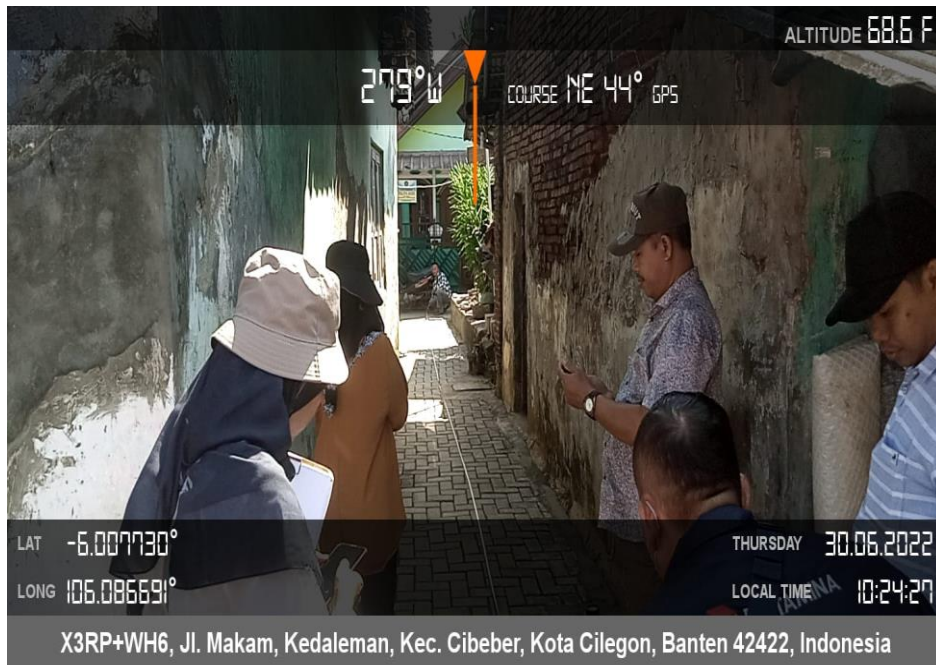
Pendampingan Tim Kotaku terhadap Pembangunan Pokmas