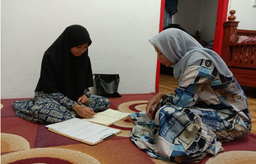
Wawancara dengan ketua kelompok masyarakat (pokmas) Kelurahan Kedaleman