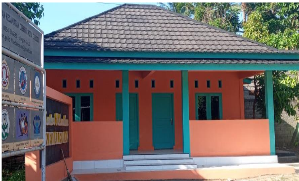
Hasil Pembangunan Posyandu di Lingkungan Kalang Anyar