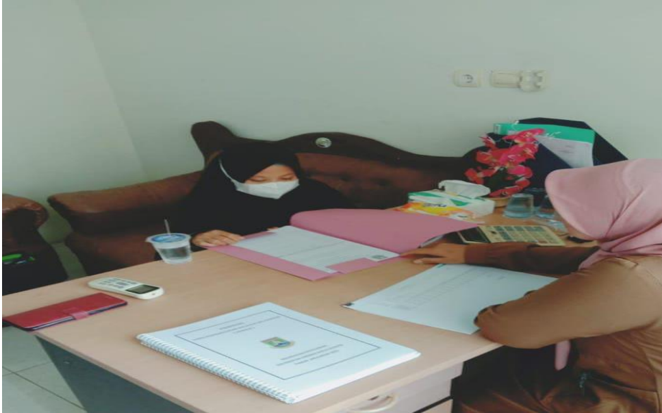
Wawancara dengan kepala seksi pemerintahan Kelurahan Kedaleman