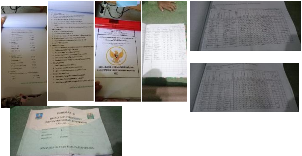
(Berkas Kepala Desa Dan Pendataan Posyandu Kampung Bayongbong)