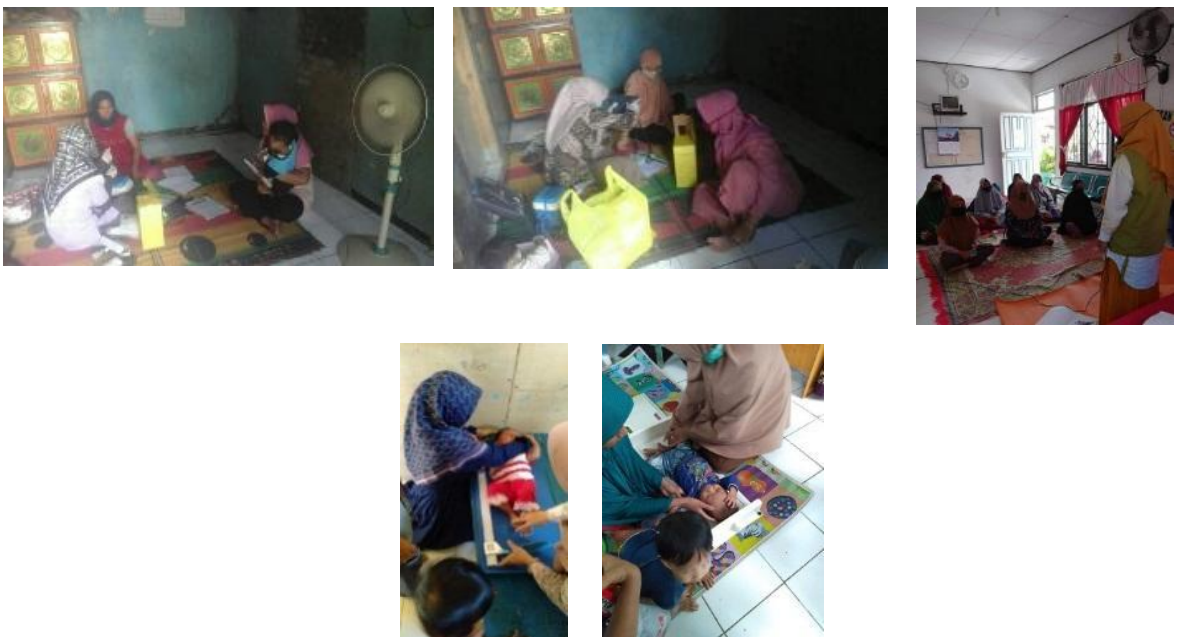
(Penyuluhan Dan Kegiatan Strategi Pencegahan Stunting Melalui Deteksi Dini Dan Edukasi Orang Tua)