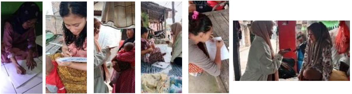
(Orang Tua Anak Kampung Bayongbong)