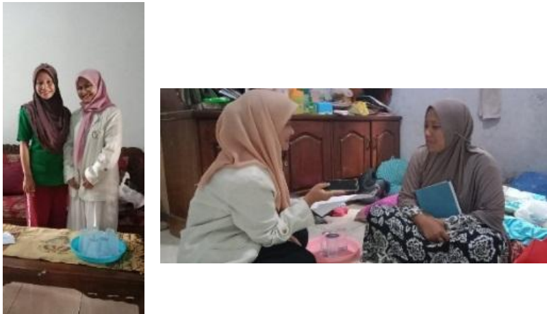
(Bidan dan Kader Posyandu Kampung Bayongbong)