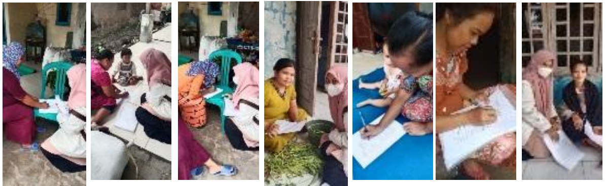
(Orang Tua Anak Kampung Pemanjaran)