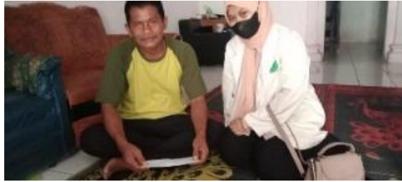
(Kepala Desa Dan Sekretaris Kepala Desa Linduk)