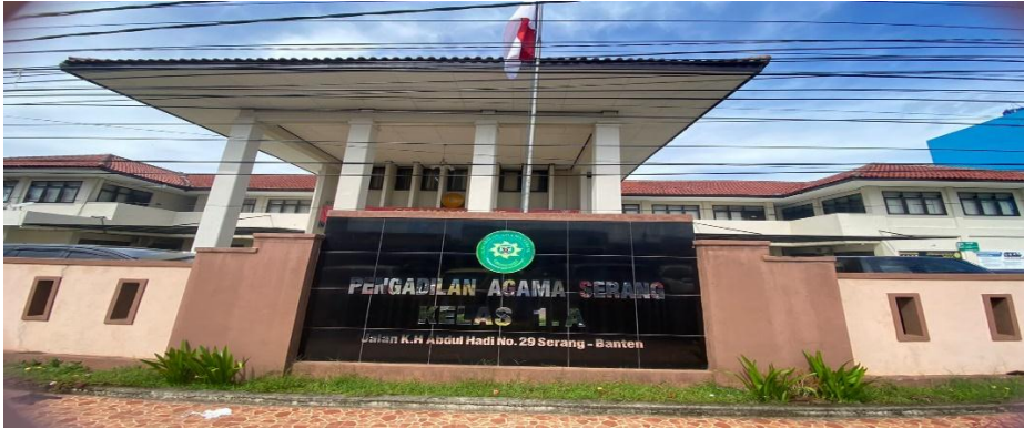
Gambar 4 Gedung Pengadilan Agama Serang Kelas 1.A