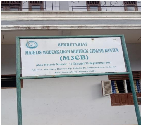
M3CB tempat pembinaan santri dan alumni dalam bahtsul masail