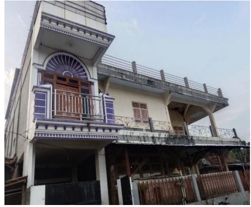
Asrama Santri Putri PP Roudhotul 'Ulum Cidahu, (Kobong)