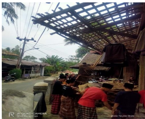
Gotong Royong Para Santri Renovasi Asrama Santri