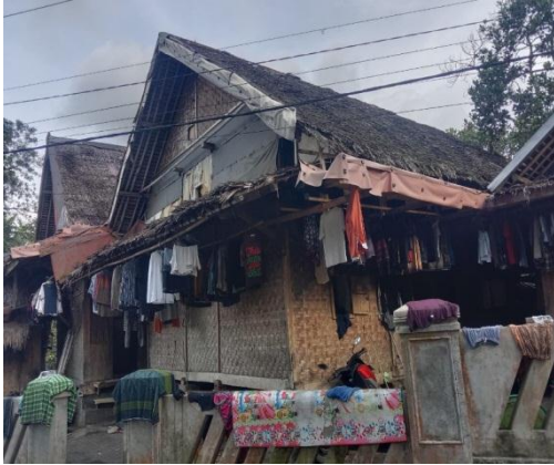
Asrama Santri Putra PP Roudhotul 'Ulum Cidahu, (Kobong)