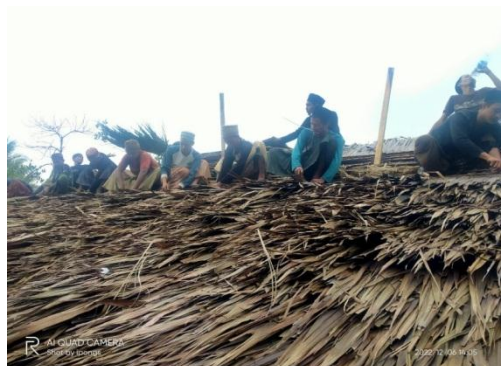
Kerbersamaan santri PP Roudhotul 'Ulum Cidahu Pandeglang