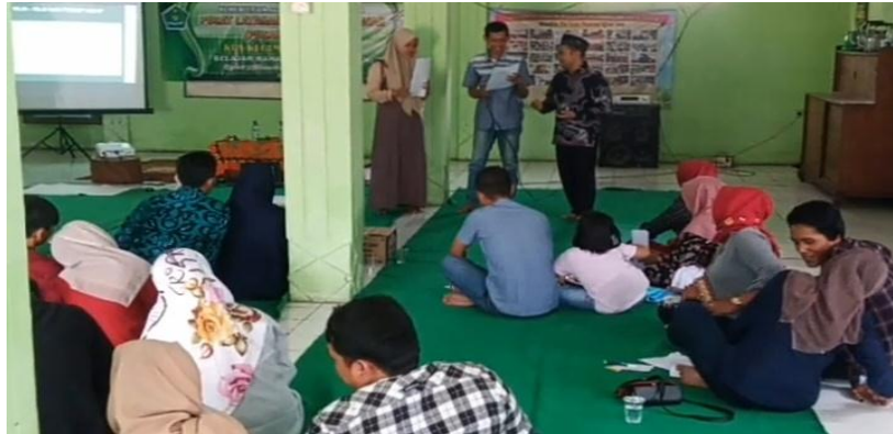
Dokumentasi: Kegiatan Pelaksanaan Program Pusaka Sakinah