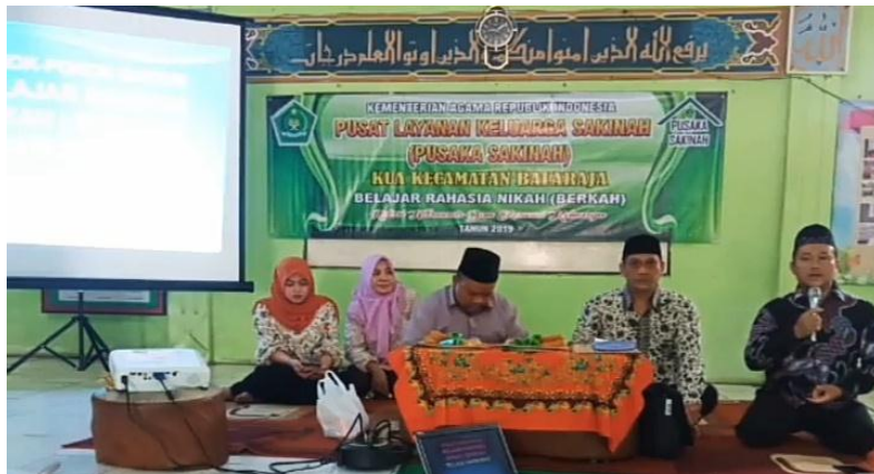
Dokumentasi: Penyampaian Materi Program Pusaka Sakinah