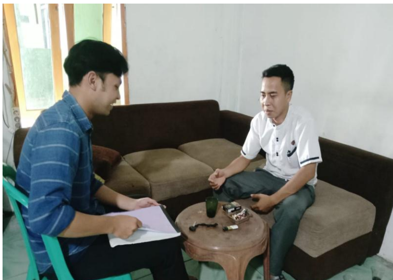
Dokumentasi: Wawancara Dengan Pegawai KUA Kec. Balaraja