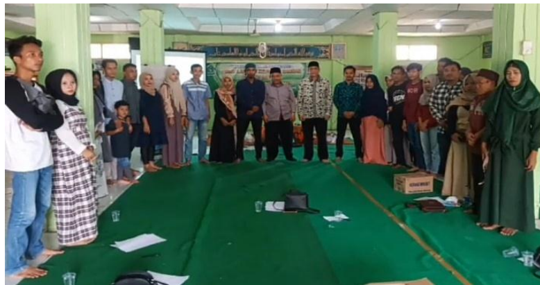
Dokumentasi: Kegiatan Pelaksanaan Program Pusaka Sakinah