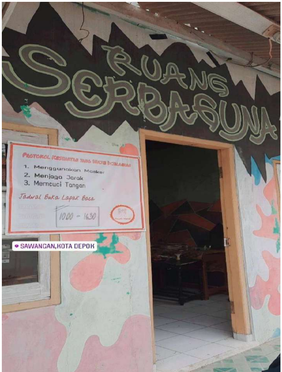
Tampak depan ruang serbaguna yang digunakan program lapak baca