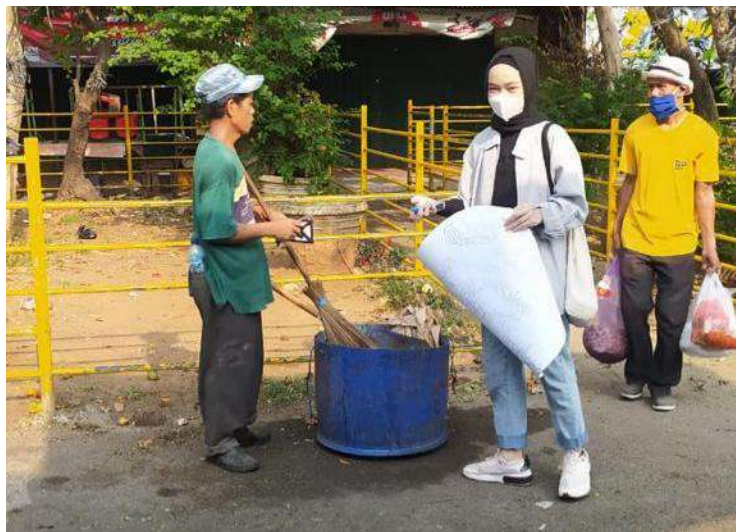
Kegiatan bersih-bersih minggu pagi bersama warga RT. 10