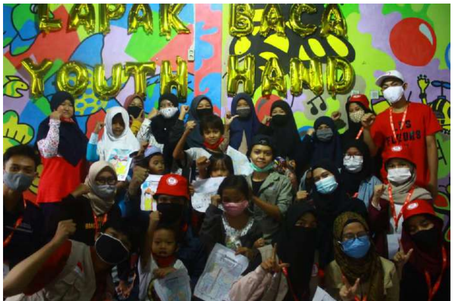
Pembukaan dan peresmian program lapak baca