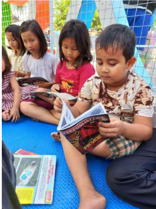
Pelaksanaan program lapak baca