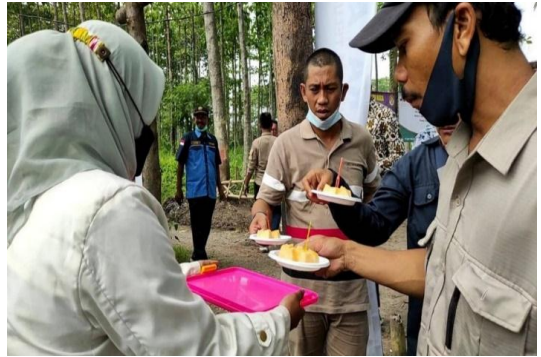
Panen Raya, Mencicipi Hasil Pertanian Karang Taruna Bertani Desa Teluknaga