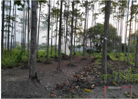
Lahan Wisata Edukasi, Karang Taruna Bertani