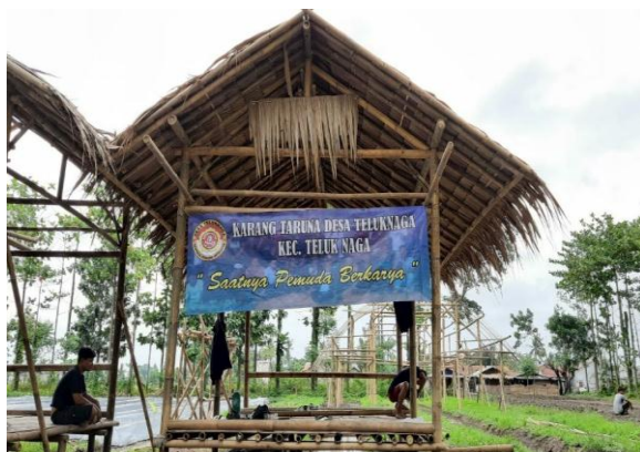
Saung Katar Bertani Desa Teluknaga