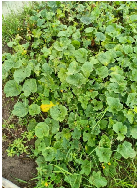
Hasil Pertanian Karang Taruna Bertani Desa Teluknaga