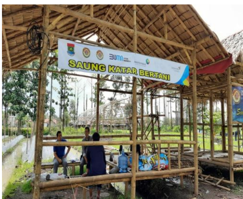
Saung Katar Bertani Desa Teluknaga