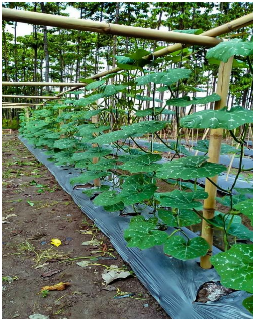
Lahan Karang Taruna Bertani