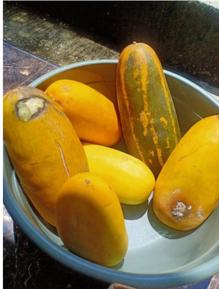
Hasil Pertanian Karang Taruna Bertani Desa Teluknaga