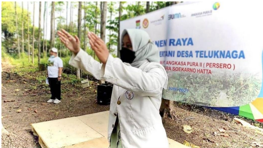
Panen Raya, Karang Taruna Bertani Desa Teluknaga