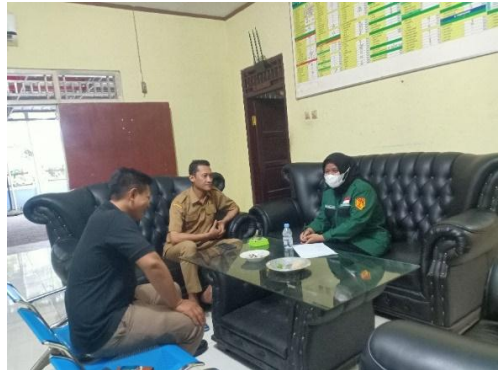
Wawancara Dengan Jajaran Pemerintahan Desa Teluknaga