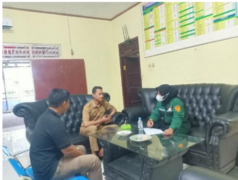
Wawancara Dengan Jajaran Pemerintahan Desa Teluknaga