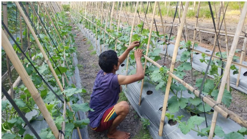
Lahan Wisata Edukasi, Karang Taruna Bertani