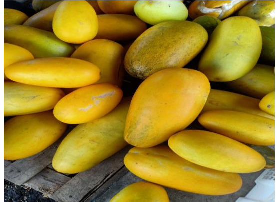
Hasil Pertanian Karang Taruna Bertani Desa Teluknaga