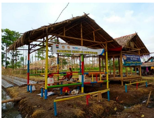
Saung Katar Bertani Desa Teluknaga