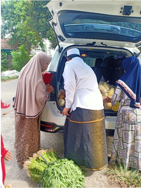
Penjualan Hasil Pertanian Karang Taruna Bertani Desa Teluknaga