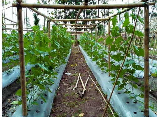
Lahan Pertanian, Karang Taruna Bertani