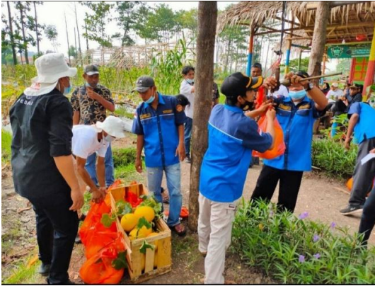
Proses Penjualan Hasil Pertanian, Program Katar Bertani