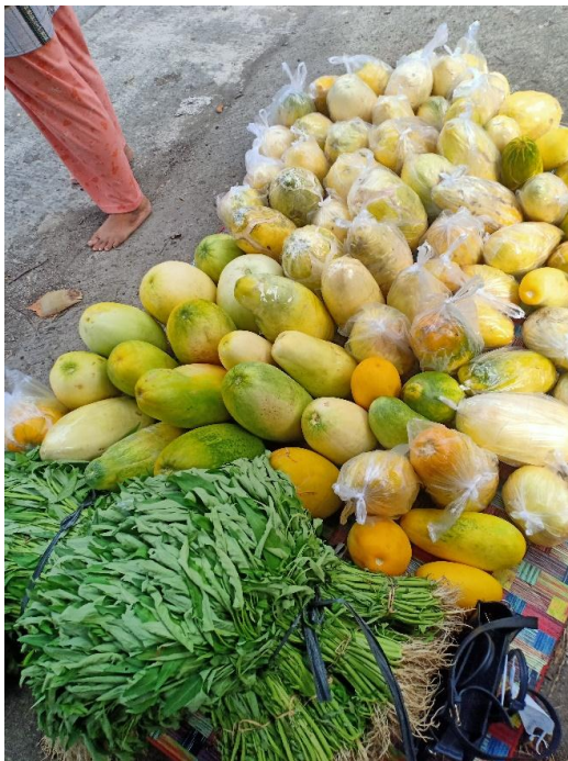
Hasil Pertanian Karang Taruna Bertani Desa Teluknaga