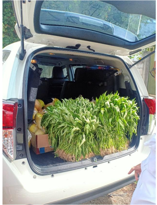
Penjualan Hasil Pertanian Karang Taruna Bertani Desa Teluknaga