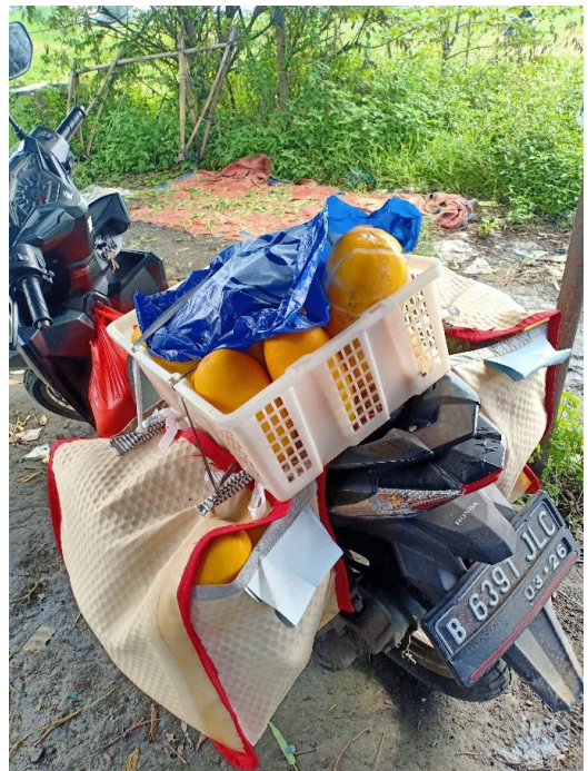
Hasil Pertanian Karang Taruna Bertani Desa Teluknaga