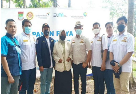
Foto Bersama Karang Taruna Kecamatan Teluknaga