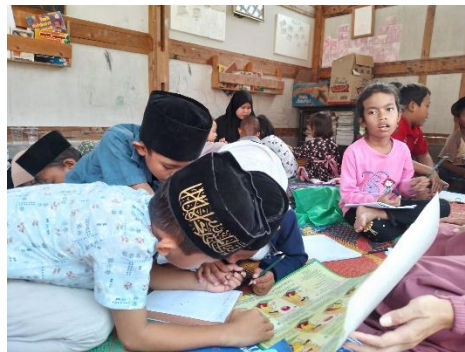
Dokumentasi kegiatan TBM Sukabaca