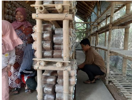
Dokumentasi kumbung jamur Rumah Momong Kragilan