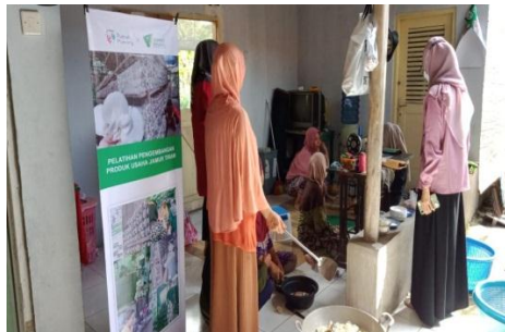
Dokumentasi proses pengolahan keripik jamur