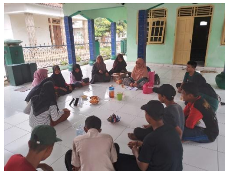
Dokumentasi kegiatan Kelas Remaja di Mushola Raudhatul Jannah RT.