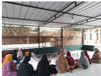
Dokumentasi kegiatan Kelas Parenting di Mushola Raudhatul Jannah RT. 019 RW. 002