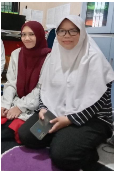
Guru Pendidikan Agama Islam Kelas IX