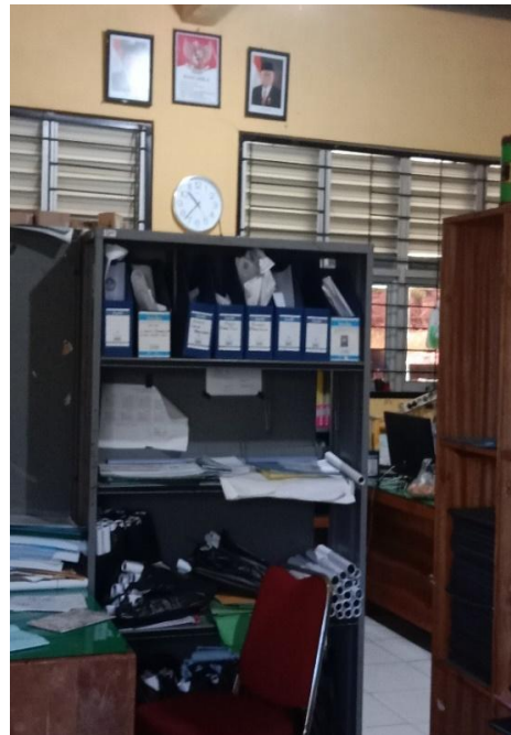
Ruang TU SMP Negeri 2 Cikupa