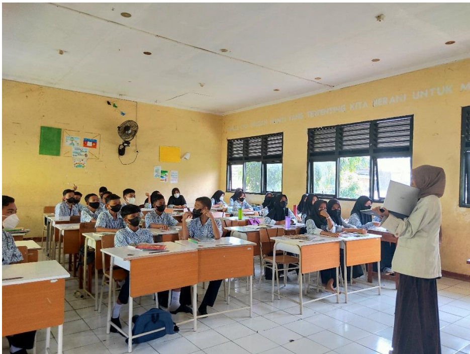
Ruang Kelas SMP Negeri 2 Cikupa