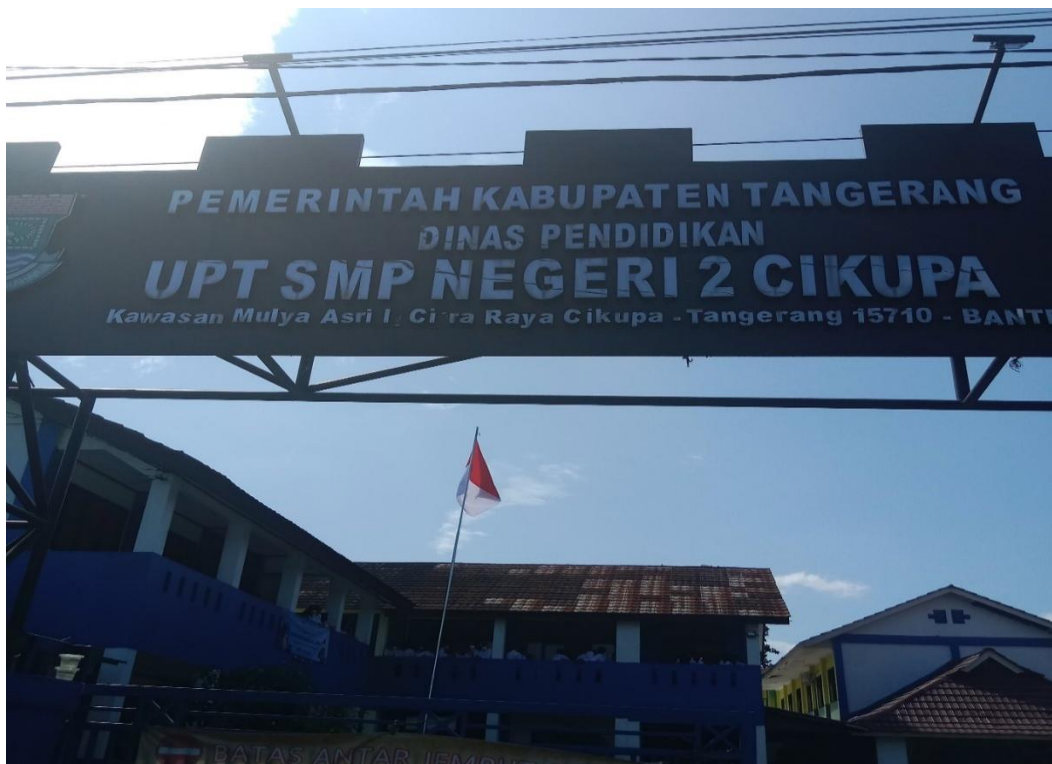
Gerbang SMP Negeri 2 Cikupa