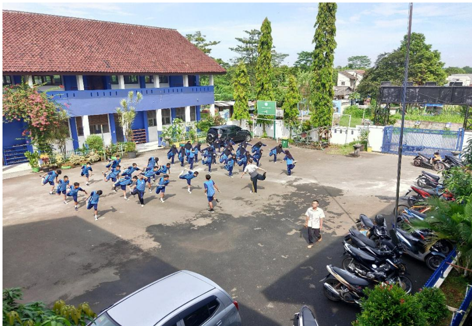
Lapangan SMP Negeri 2 Cikupa