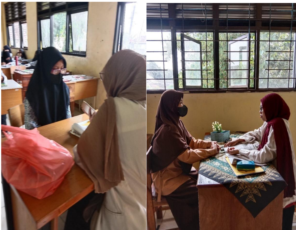
Wawancara Peserta didik kelas VIII. FWawancara Peserta didik kelas VIII. A