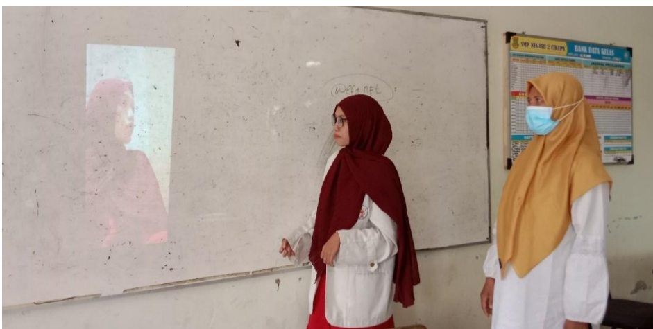
Menampilkan Video Dakwah di Aplikasi Tiktok pada peserta didik bersama Guru PAI