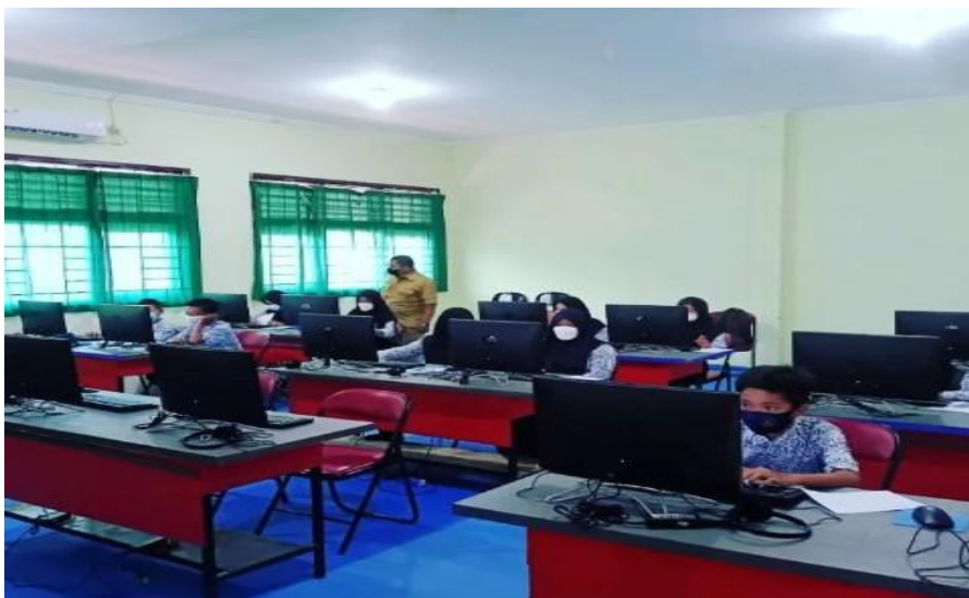
Ruang Komputer SMP Negeri 2 Cikupa