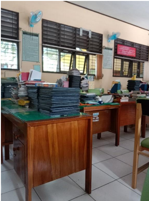
Ruang Guru SMP Negeri 2 Cikupa