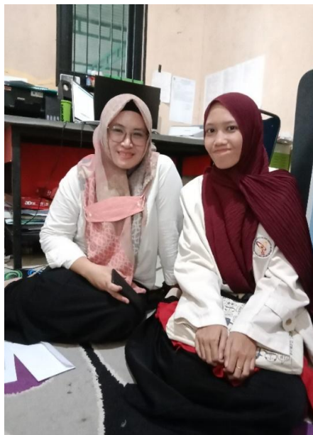
Guru Teknologi Informasi (TIK)