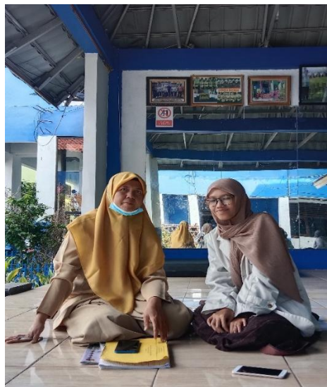
Guru Pendidikan Agama Islam Kelas VIII