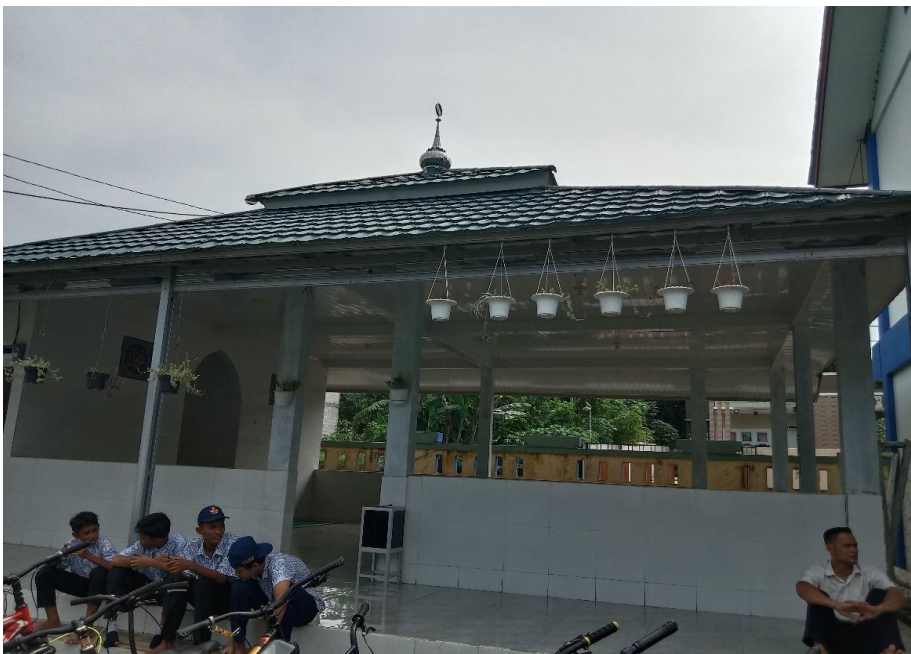
Musolah SMP Negeri 2 Cikupa