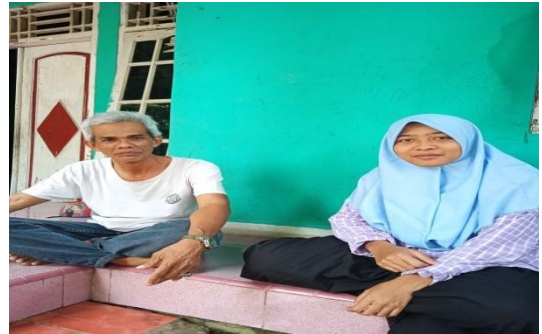
Pembeli Ibu Suirat