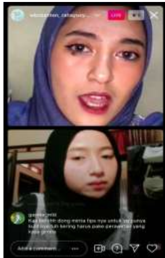
d) Tampilan akun instagram @wbcabanten