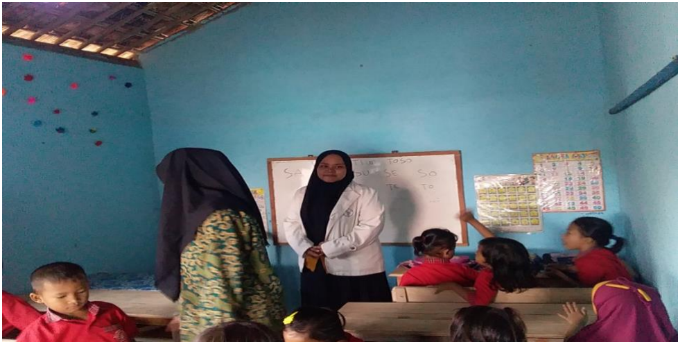
KBM PAUD BKB KEMAS NURI