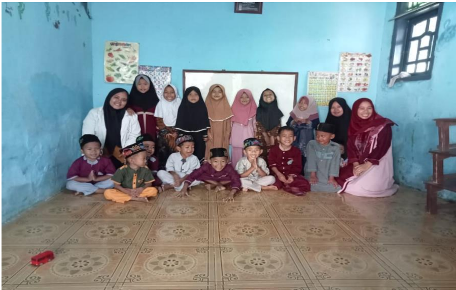
Dokumentasi dengan siswa kelas B PAUD BKB Kemas Nuri