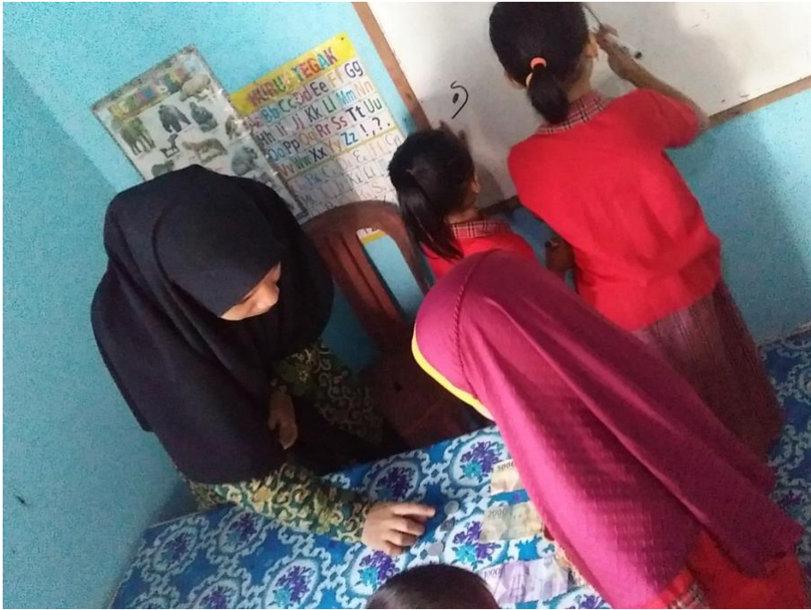
KBM Pengenalan Uang PAUD BKB Kemas NURI