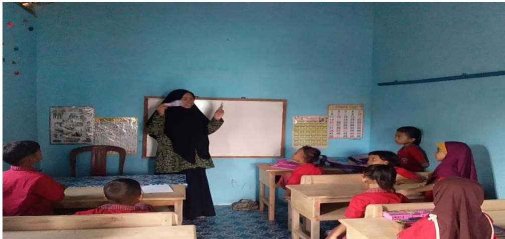
KBM PAUD BKB Kemas Nuri