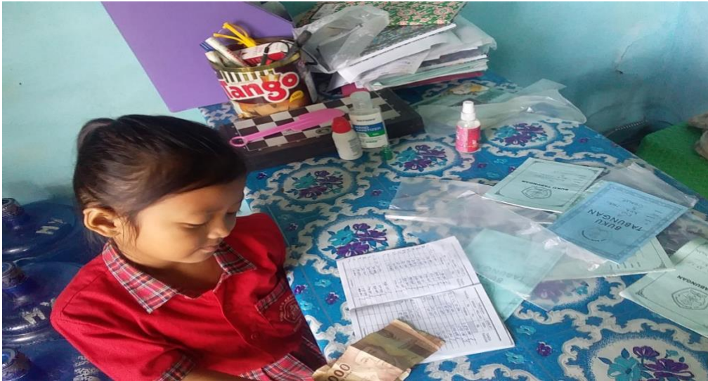
Dokumentasi Siswa Saat Menabung Di Sekolah