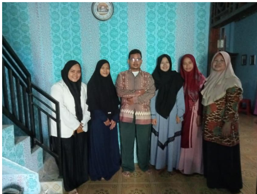
Bersama Dewan Guru kepala Sekolah Beserta Bapak Pendiri PAUD BKB Kemas Nuri