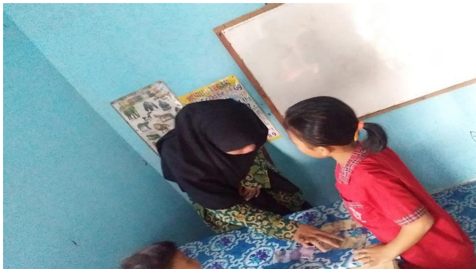
Pengenalan Uang Pada Anak Kelas B