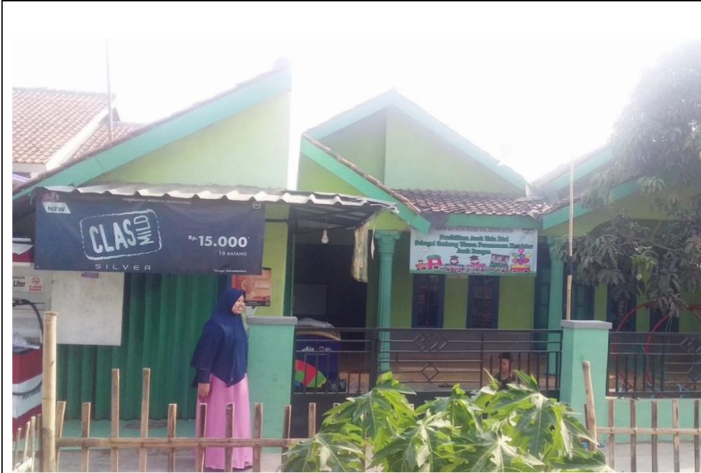
Tampak depan sekolah