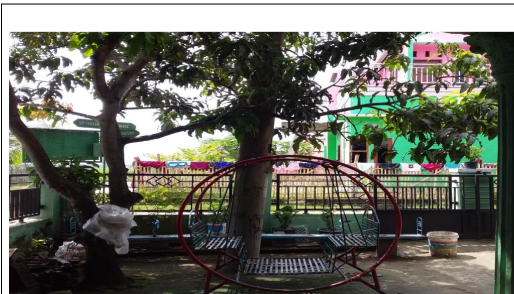
Halaman depan PAUD BKB Kemas NURI