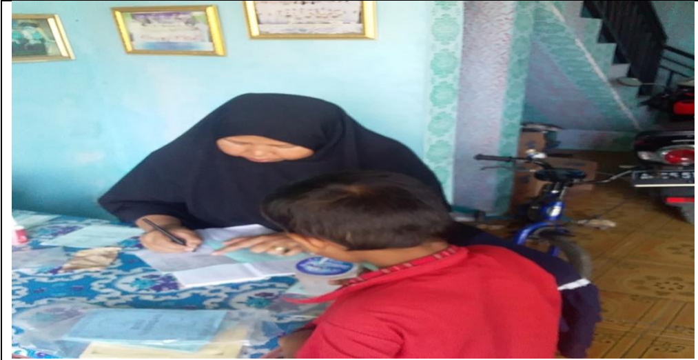
Dokumentasi Siswa Saat Menabung