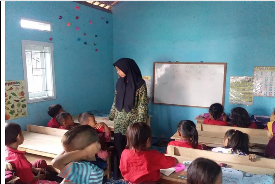
Kegiatan Belajar Mengajar PAUD BKB KEMAS NURI